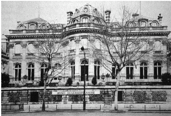
4. L'hôtel Jacquemart-André visto da boulevard Haussmann. The Jacquemart-André mansion seen from Boulevard Haussmann.